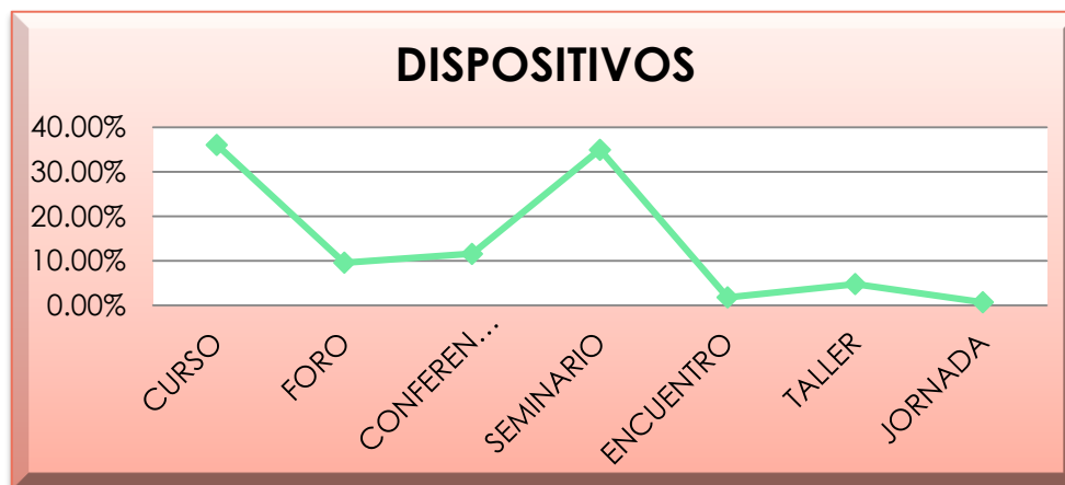
Cuadro No.2. Variables de cada Asunto Clave