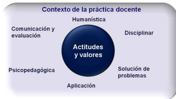
Fig. 1 Competencias docentes impregnadas de valores y actitudes que identifican al profesor de la Facultad de Medicina, UNAM. (Tomado de Martínez, López, Herrera et al, 2008).

Este instrumento tomó como referente y sustento el modelo de competencias docentes desarrollado por un equipo docente de la Facultad, las competencias se indican en la figura 1.