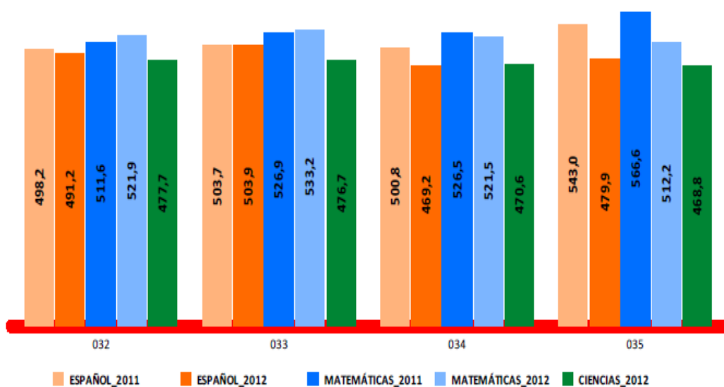
Figura 2. Resultados por Zona Escolar. Primaria. 2011 y 2012