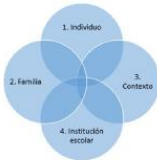
FIGURA 1 MODELO IFCI