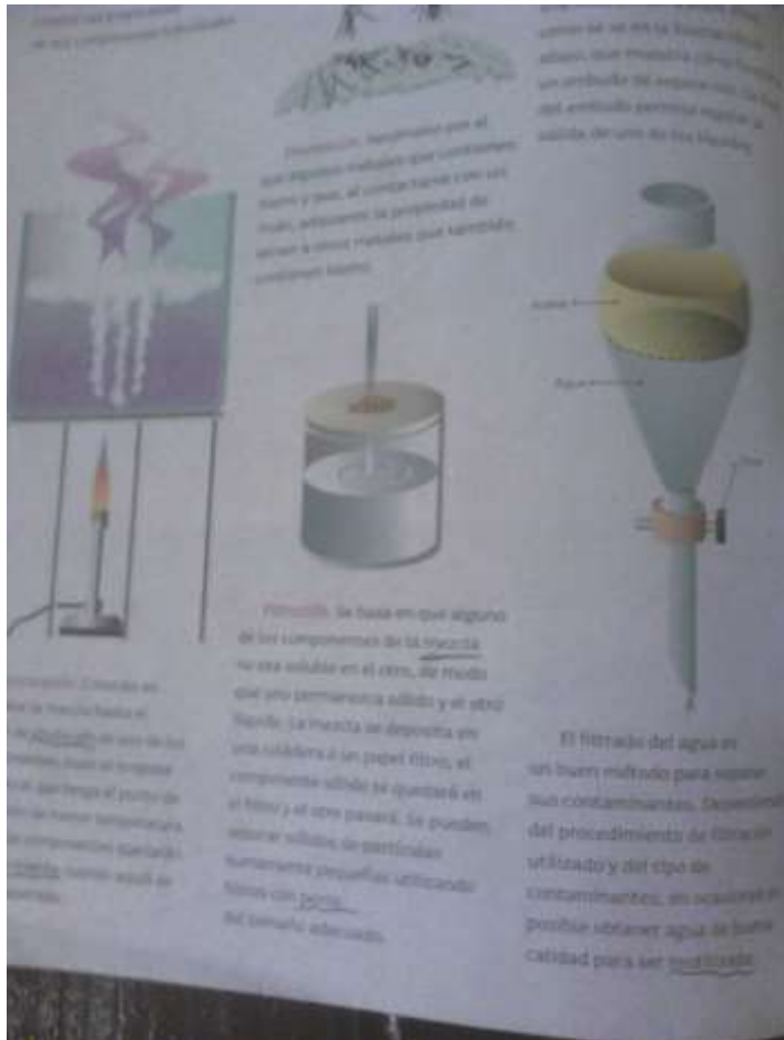
EVIDENCIA DE TÉCNICA DE SUBRAYADO