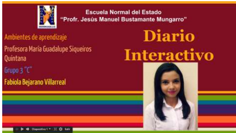
Figura 1 Ejemplo de la presentación del diario interactivo en línea

Asimismo la figura 1 y 2 ilustran el diseño del diario en la plataforma Google Drive .