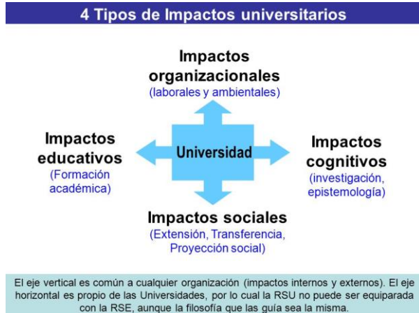
Figura 1. Tipos de impactos universitarios en el entorno.

contrataciones, relaciones de extensión y de vecindario, participaciones sociales, económicas y políticas (Vallaeyes et al. , 2009).