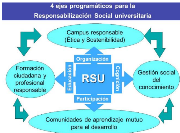
Figura 2. Ejes/Dimensiones de responsabilidad social.

Por su parte, Vallaeyes et al. (2009) identifican cuatro ejes/dimensiones de la RSU, los que se desprenden de los impactos generados por el quehacer universitario: Campus responsable, Formación profesional y ciudadana, Gestión social del conocimiento y Participación social, como muestra la figura 2.