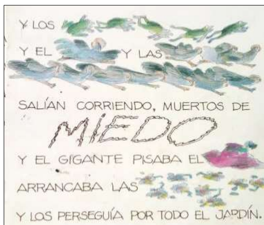
Figura 2. Páginas con relación imagen-texto directa

Así también definimos como relación directa entre la imagen y el texto, a la que se observa cuando lo escrito y la imagen se complementan ya sea al sustituir partes del texto o al ampliar el significado dado en el escrito a partir de la tipografía. Este último término alude a las familias tipográficas que utiliza el editor al realizar la puesta en página.