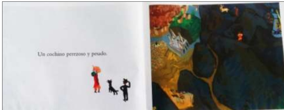
Figura 5. Relación indirecta entre imagen-texto. Falta de elementos enunciados en el texto (cochino) en la primera imagen, lado izquierdo. Falta de precisión en el sentido que da el texto (adjetivos del cochino) en la segunda imagen, al lado izquierdo.

Al terminar de leer se retomaron las predicciones para realizar una comparación entre lo que pensaron que iba a pasar con lo que realmente pasó, además se plantearon preguntas que permitieran a los alumnos reconstruir la historia. Enseguida por medio de materiales como imágenes y título del cuento y organizados en equipos, los alumnos hicieron la edición de páginas sobre el cuento leído, para luego contarlos a sus compañeros y así poder validar la construcción del significado.