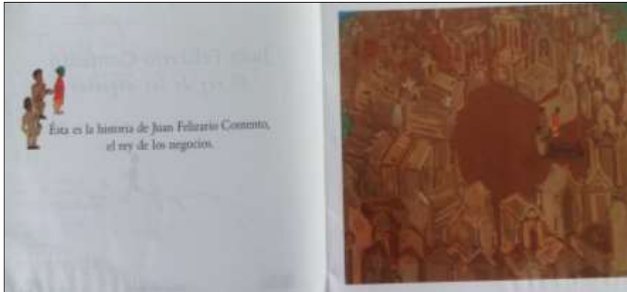
Figura 3. Páginas del cuento “Juan Felizario Contento”