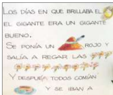
Figura 4. Páginas del cuento “Había una vez una casa”