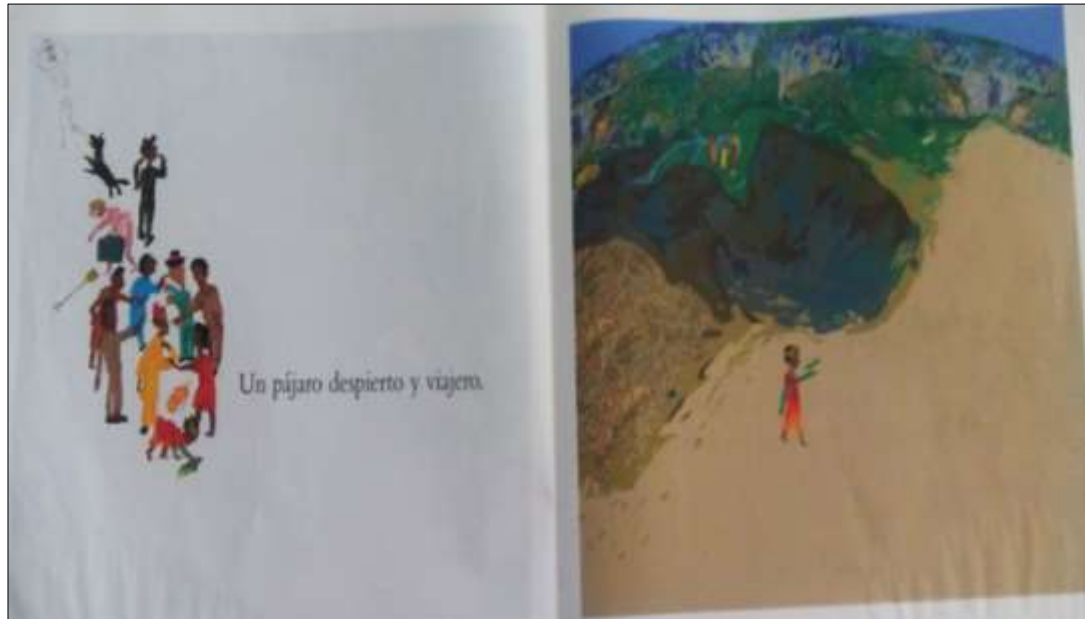
Figura 1. Páginas con relación imagen-texto indirecta

contenido del texto, debido a que al momento de confrontar lo que está leyendo con lo que presenta la imagen no son del todo congruentes.