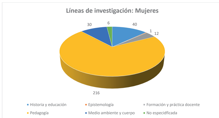
Gráfica 2: Fuente (Keyser y Padilla, 2017 p. 13)

Como se observa en las gráficas, la proporción que guardan los trabajos en la línea pedagógica son prácticamente iguales (hombres 71% y mujeres 70%).