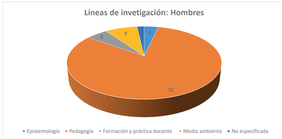
Gráfica 2: Fuente (Keyser y Padilla, 2017 p. 13)