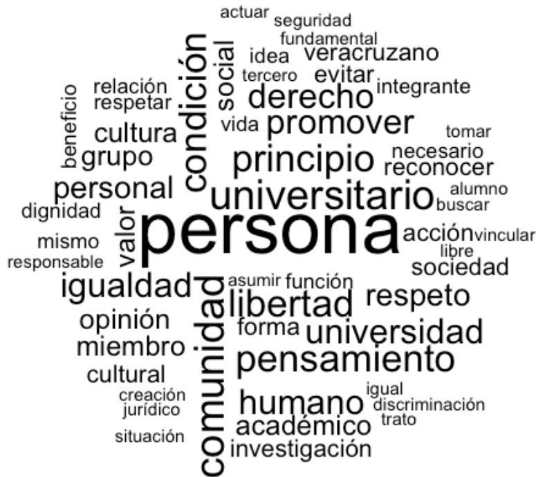
Figura 5. Nube de palabras institucional