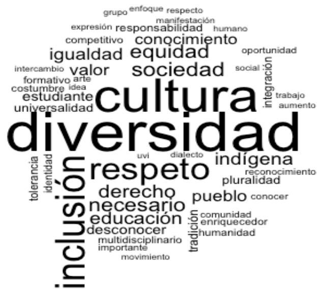
Figura 3. Representaciones sobre interculturalidad. Nube de palabras de los académicos cuando piensan en el proyecto intercultural de la UV