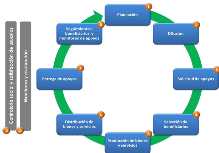
Figura 1 Modelo General de Procesos