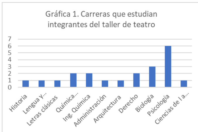
Gráfica 1. Carreras que estudian integrantes del taller de teatro

A partir de la información que se obtuvo a través de los cuestionarios, identificamos que el taller de teatro en Facultad de Psicología se conforma por estudiantes de diversas carreras que se imparten en la UNAM (ver Gráfica 1) (75% son del sexo femenino y 25% masculino) en una edad promedio de 22 años. La gran mayoría (71%) son estudiantes que cursan los últimos semestres de la licenciatura (del 6to al 10mo semestre) o realizan su tesis y sólo el 29% son estudiantes que inician su carrera (2do y 3er semestre) (ver Gráfica 2).