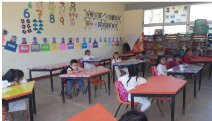
Figura 2. Proyecto cuidado de la Salud, los niños reconocen la importancia de alimentarse adecuadamente realizado por alumnos de preescolar Ajalpan, Puebla