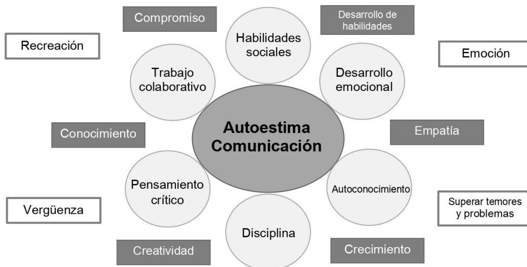
Figura 3. Esquema de procesamiento tercera instrucción: Escribe en orden de importancia cinco cuestiones en las que el Teatro haya ayudado a tu desarrollo personal

El hecho de que la comunicación tenga un peso semántico tan importante implica no solo la necesidad comunicativa de los estudiantes, sino que reafirma la búsqueda de espacios de expresión que les permitan dar a conocer al mundo sus emociones y pensamientos, sus reflexiones.