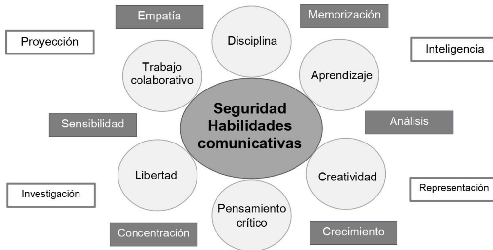
Figura 2. Esquema de procesamiento segunda instrucción: Escribe cinco palabras en orden de importancia que expresen cómo ayuda el Teatro a tu desarrollo académico

Al momento de analizar la tercera instrucción, en donde abordan cómo el teatro les ha ayudado en su desarrollo personal, se observa gran similitud de las respuestas con la instrucción anterior, probablemente debido a que, como estudiantes, ubican que su desarrollo personal va muy ligado al académico.