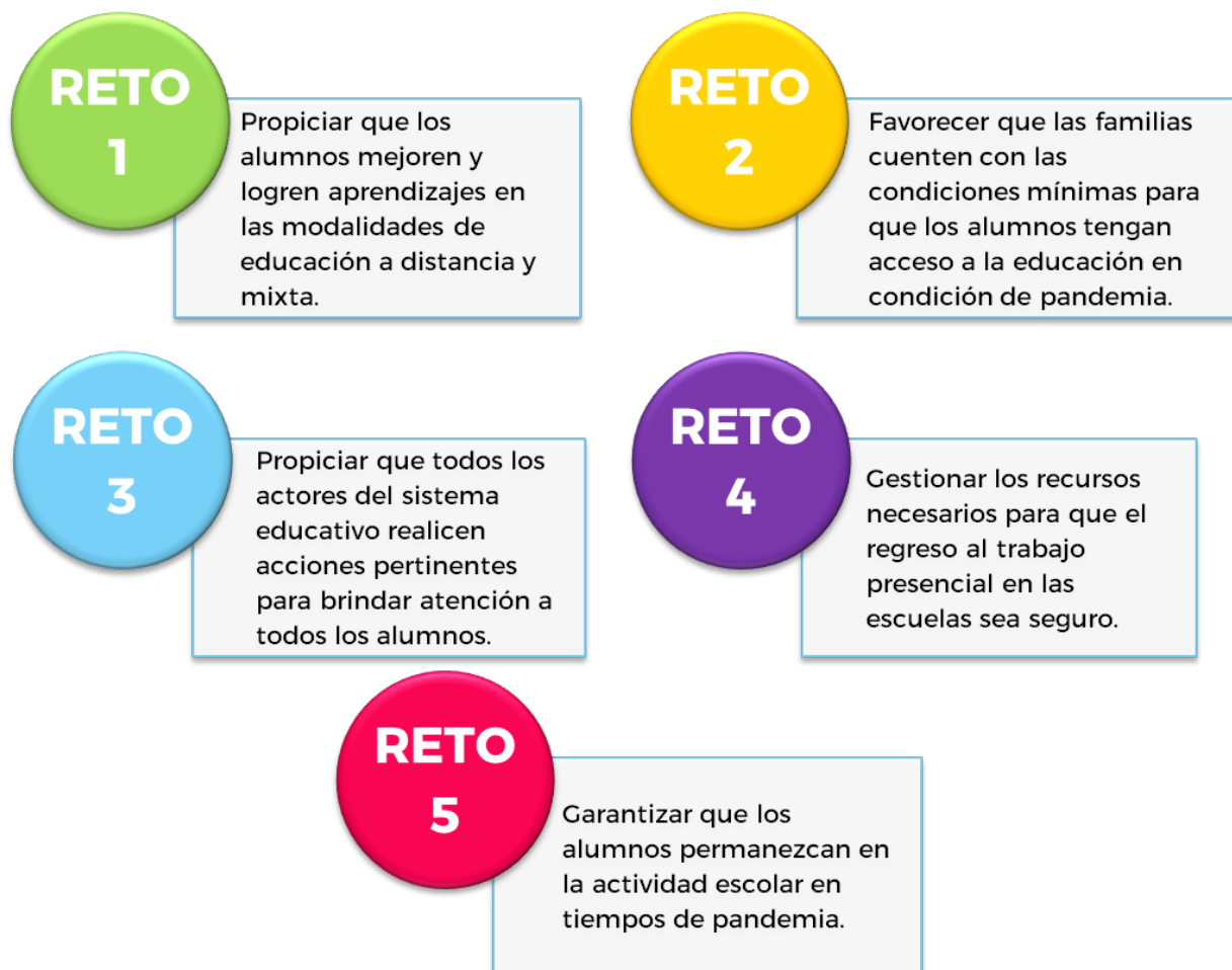
Figura 2. Los retos educativos de Jalisco ante la pandemia

Los retos se desdoblaron en objetivos específicos, a través de los cuales es imprescindible implementar acciones que faciliten al sistema educativo jalisciense, lograr estas máximas aspiraciones y así superar las dificultades que le ha colocado la pandemia. A continuación, se listan tales objetivos.