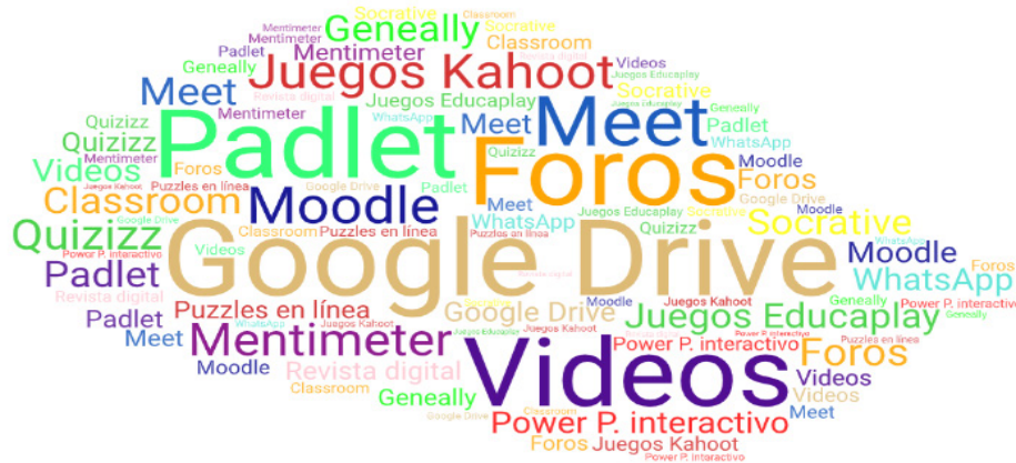
Figura 2. Los recursos tecnológicos para el aprendizaje empleados. Creación de un estudiante