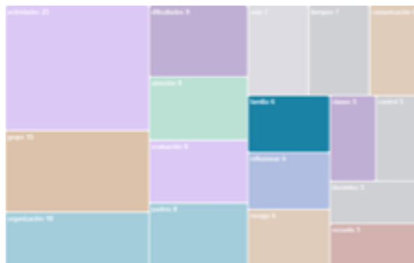
Ilustración 3 Dificultades experimentadas en la práctica profesional

Otras dificultades son la falta de estrategias para enfrentar situaciones de autorregulación de emociones y las conductas disruptivas.