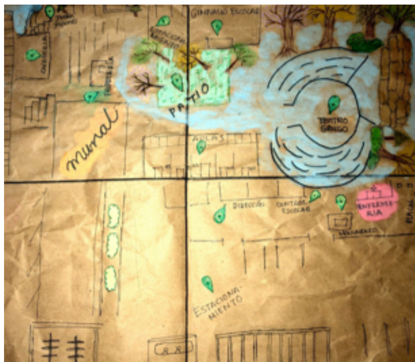
Ilustración 2: Mapa perceptual en el que se señalan espacios como la enfermería y el teatro griego como áreas de significado

Con respecto a las experiencias los resultados arrojan que gran parte de los estudiantes disfrutaban de los espacios abiertos más que de los cerrados y así mismo evocan mayor número de experiencias en espacios informales como los jardines, los espacios que más destacan con sus respectivas actividades de convivencia son: el Teatro griego y los jardines frente a la Unidad de Investigación con las menciones más reiterativas en casi todos los mapas.