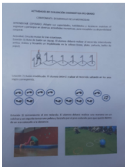
Imagen 2. Hojas guía para evaluación