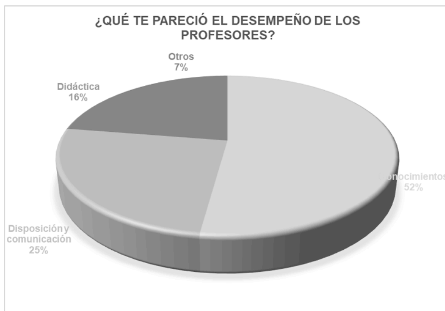
Figura 5. Desempeño de los profesores