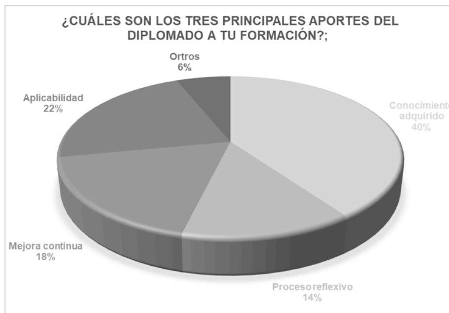
Figura 1. Aportes del diplomado a su formación

¿Los conocimientos que adquiriste son transferibles a tu práctica profesional y/o académica?, ¿Cómo?;