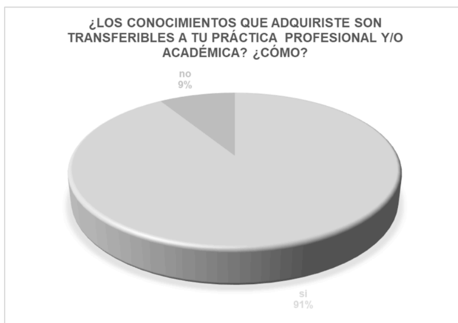
Figura 2. Los conocimientos adquiridos son transferibles

No he tenido los espacios para extrapolar los conocimientos a mi práctica profesional, sólo algunos elementos aislados, No, al 100 % porque pesa más contexto curriculares y directivos en la institución por su aplicación literal y en ocasiones demasiado teórica de la facultad.