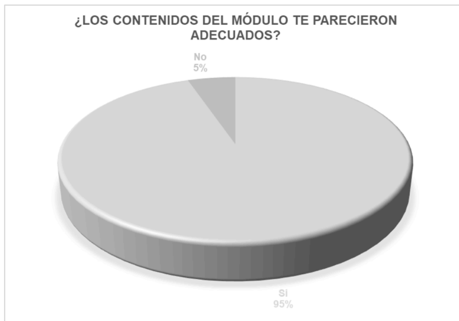
Figura 4. Contenidos adecuados