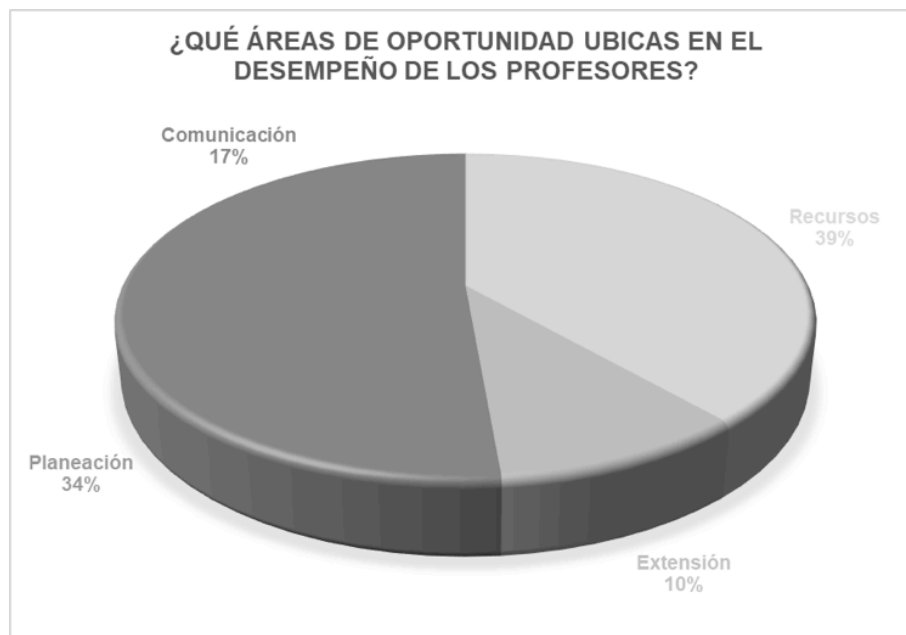
Figura 7. Áreas de oportunidad en el desempeño de los profesores

Encontrando una visión satisfactoria de los participantes en la percepción de ambos diplomados, destacando el conocimiento adquirido por los participantes, el cual en su mayoría de los contenidos son considerados como transferibles a su ejercicio profesional y adecuados, sobre el desempeño de los profesores se destaca su alto nivel de conocimientos, du perfil profesional y docente, la disposición y habilidades de comunicación mostradas, y las didácticas, viendo como área de oportunidad la necesidad de una mayor ejemplificación por parte de los profesores y la integración de recursos tecnológicos.