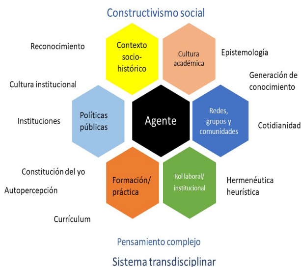
Figura 1. El agente investigador

Nota: Elaboración equipo agentes y formación de investigadores. EC COMIE.