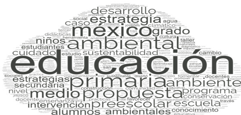
Figura 1. Nube de palabras referente a los títulos de las tesis

En la Gráfica 2 encontramos la producción de tesis por género. Se observa mayor tendencia de participación femenina en comparación al periodo anterior, aunque en ambos casos se muestra un aumento.