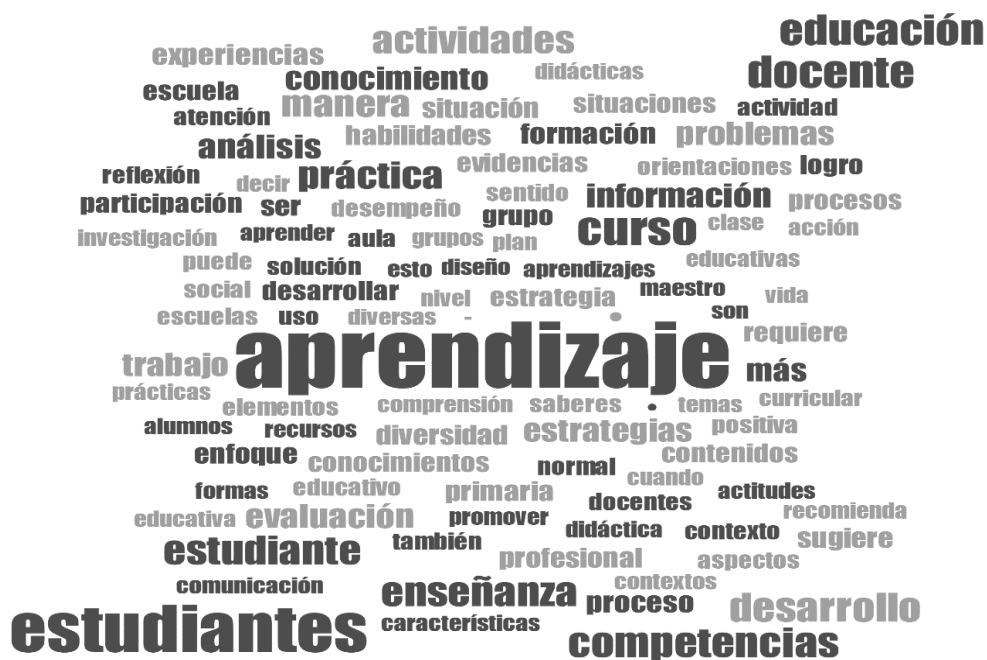
Figura 3: Nube de palabras en las orientaciones curriculares, Plan de Estudios 2018.