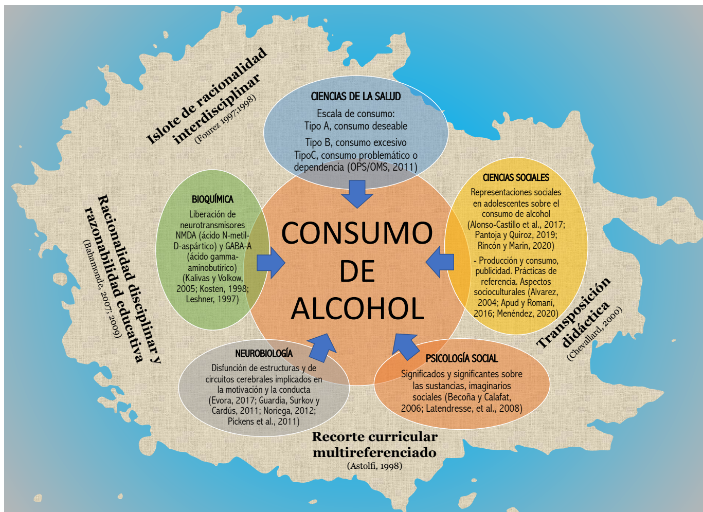
Figura 1. Islote de racionalidad disciplinar y razonabilidad educativa para el abordaje del consumo de alcohol (elaboración propia)

Desde la esfera biológica recurrimos a la neurobiología donde destacamos las explicaciones científicas en el campo enfocadas directamente sobre la disfunción neurobiológica de las estructuras cerebrales mesencefálicas, límbicas y corticales, y de circuitos cerebrales implicados en la motivación y en la conducta (Kalivas y Volkow, 2005). También en la bioquímica donde se explica cómo el alcohol actúa sobre múltiples señales cerebrales específicas, activando un complejo sistema de neurotransmisores y neuropéptidos que explicarían desde los efectos agudos a nivel conductual, hasta los efectos relacionados con dosis muy elevadas (Guardia, Surkov y Cardús, 2011). Por último, la escala de consumo que nos ofrece las ciencias de la salud nos dio pauta para el abordaje en el aula de clases por etapas.