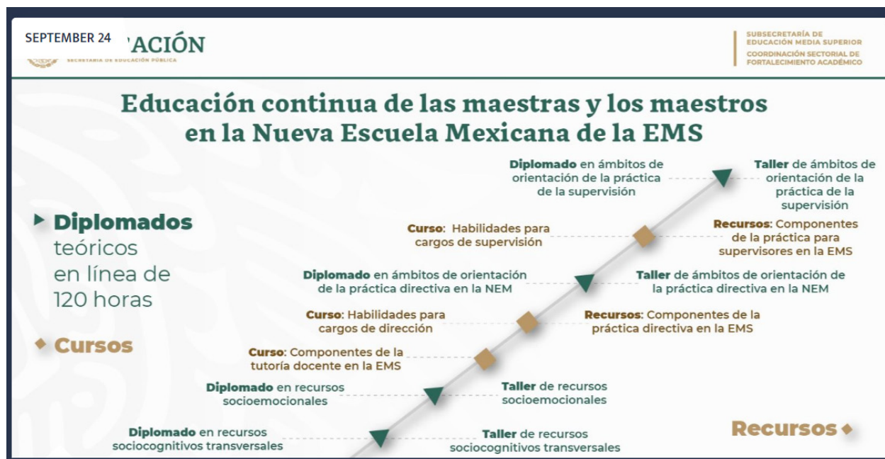
Imagen 1. Propuesta inicial de educación continua en la EMS