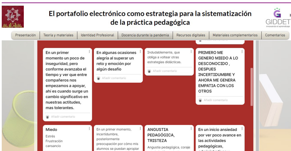
Imagen 4. Respuestas de docentes

Como se puede observar en las imágenes de resultados, se manifiesta una marcada inclinación por las respuestas relacionadas con el estado emocional, sin duda, la contextualización del estudio explica la crisis emocional que experimentaron estudiantes y docentes. Vale la pena aclarar que no fue una situación generalizada, se encontraron estudiantes y docentes que no experimentaron situaciones emocionales y escolares críticas, esto obedece al hecho de contar con situaciones materiales favorables (equipo de cómputo, acceso a internet, habilidades en el uso de la tecnología, etc.).