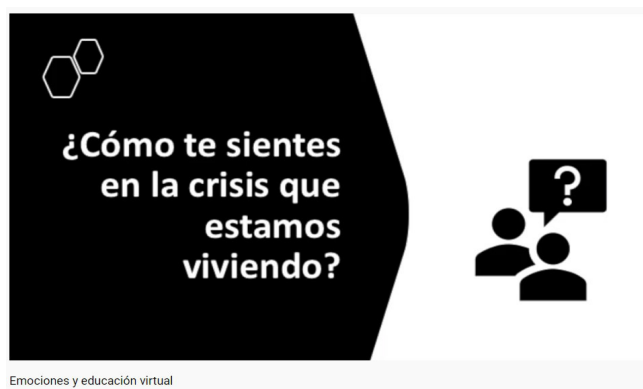
Imagen 1. Emociones y aprendizaje virtual

https://www.youtube.com/watch?v=h53B4uQzxQM