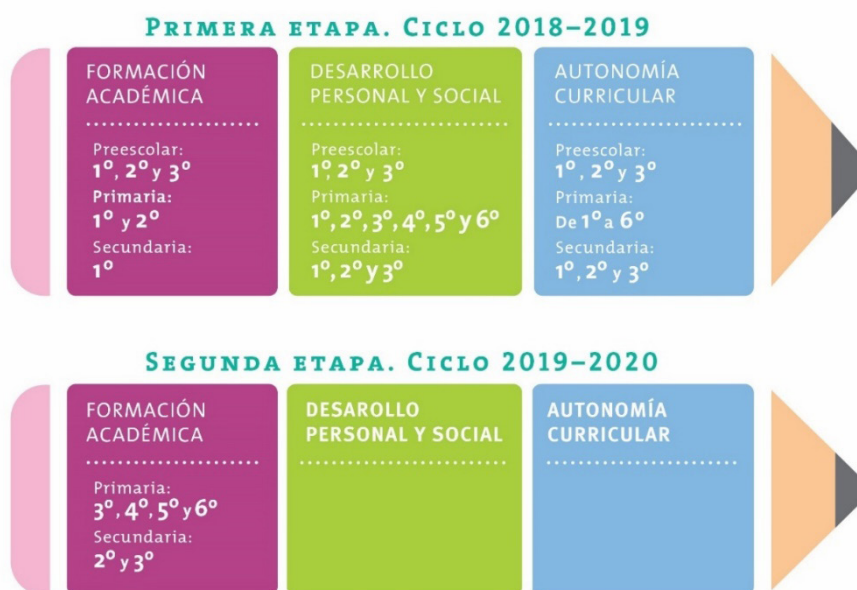
Figura 2. Entrada del Plan de Estudio y programas (2017)