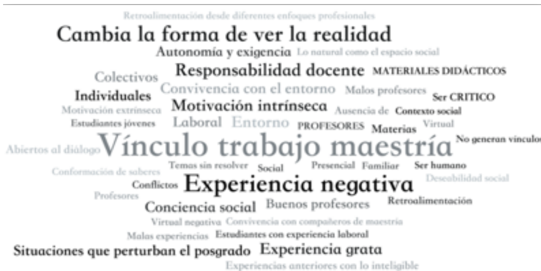
Ilustración 1. Nube de códigos hecha a partir de las tres dimensiones del proyecto