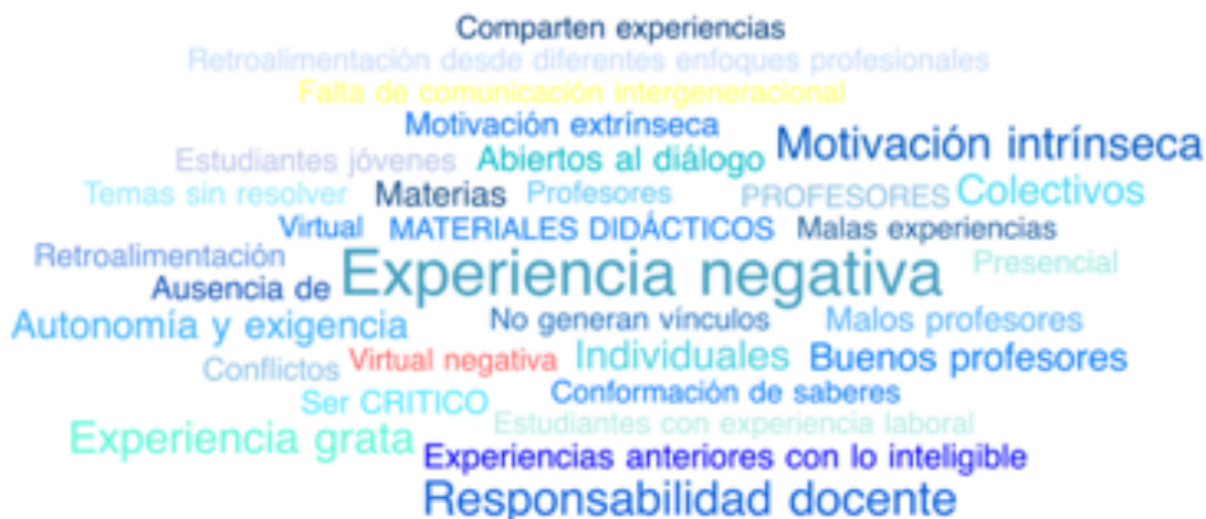
Ilustración 2. Nube de códigos dimensión: Experiencia formativa