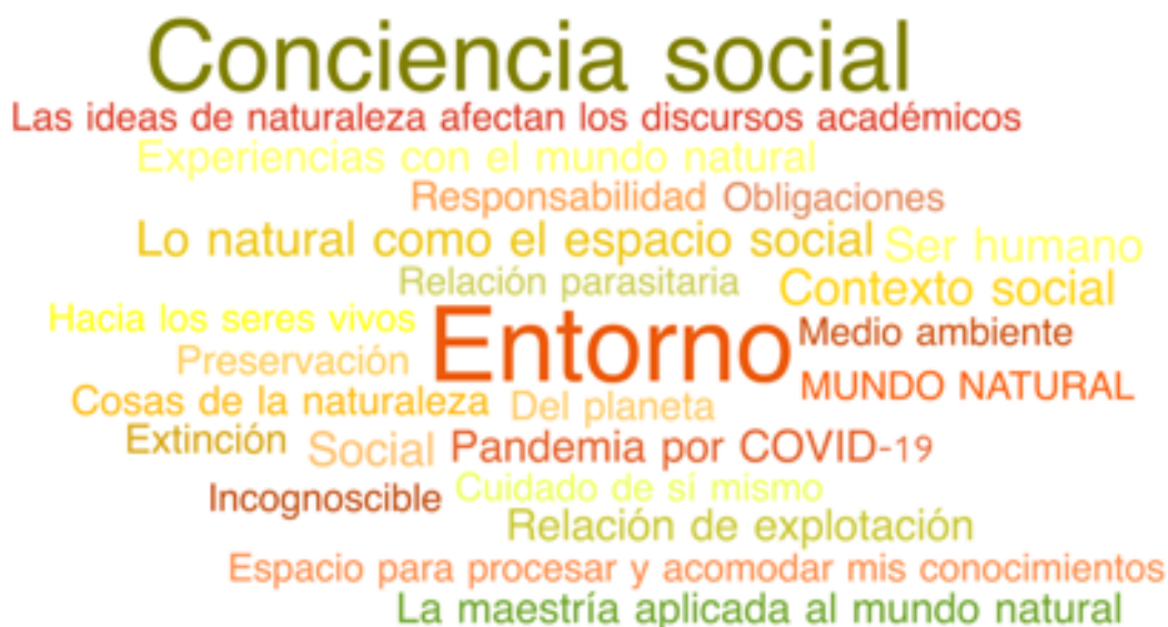
Ilustración 4. Nube de códigos dimensión: Mundo natural

Fuente: Elaboración propia con apoyo del programa MAXQDA versión 22.1.1, fecha 5 de enero de 2022.