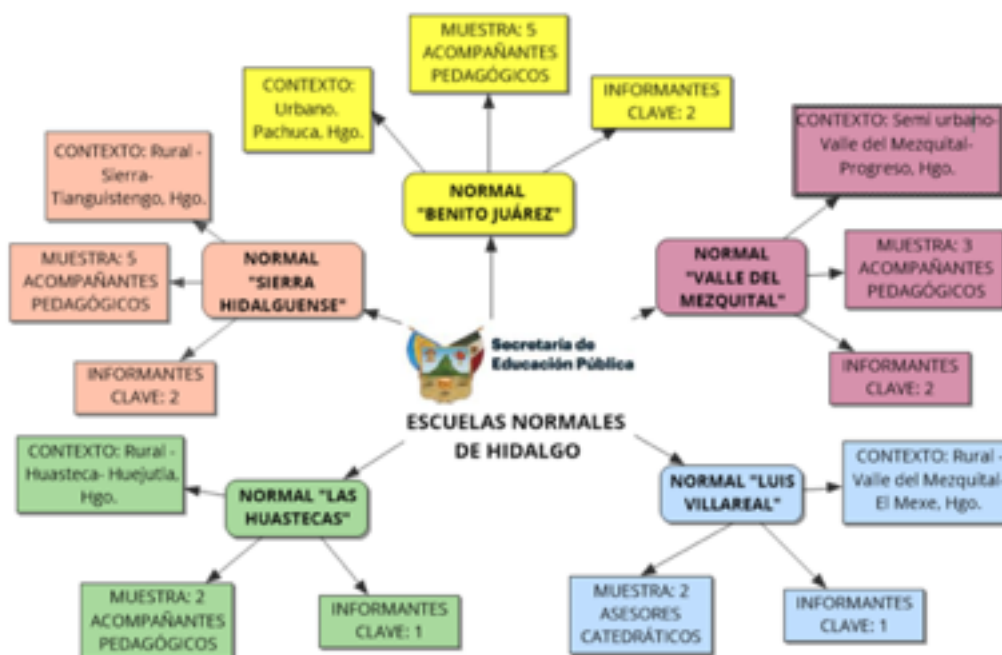
Fig. 3. Muestreo estratificado de las Escuelas Normales del Estado de Hidalgo. Realizado por Martha Edith Juárez, Rojas. 2023

Con base a lo anteriormente expuesto, se han realizado entrevistas semiestructuradas con los acompañantes pedagógicos de dos Escuelas Normales y con el informante clave de cada institución.