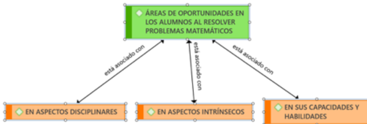
Figura 4. Áreas de oportunidad de los docentes al diseñar y manejar la resolución de problemas matemáticos