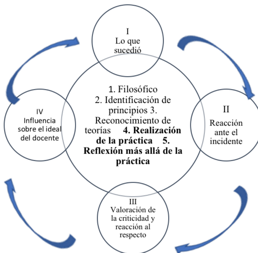
Figura 1. Integración del marco de Farrell (2019) y el esquema de Alvarado, Neira y Westmacot (2019).