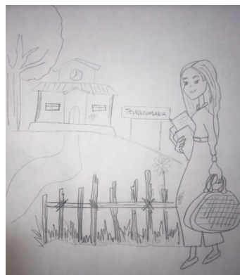
Figura 2. Db. MR Cuerpo de datos

La segunda cuestión busca saber cómo se proyecta el estudiante normalista respecto a la actividad docente que piensa llevar a cabo. Los participantes manifestaron estar conscientes de que su ejercicio profesional está en comunidades rurales o marginadas con poca población. Todos los participantes aspiraron obtener una plaza dentro del Sistema Educativo Nacional en Telesecundaria que es la licenciatura que estaban cursando (Figura 2)