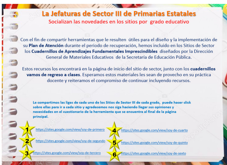
Figura 2. Aula Virtual