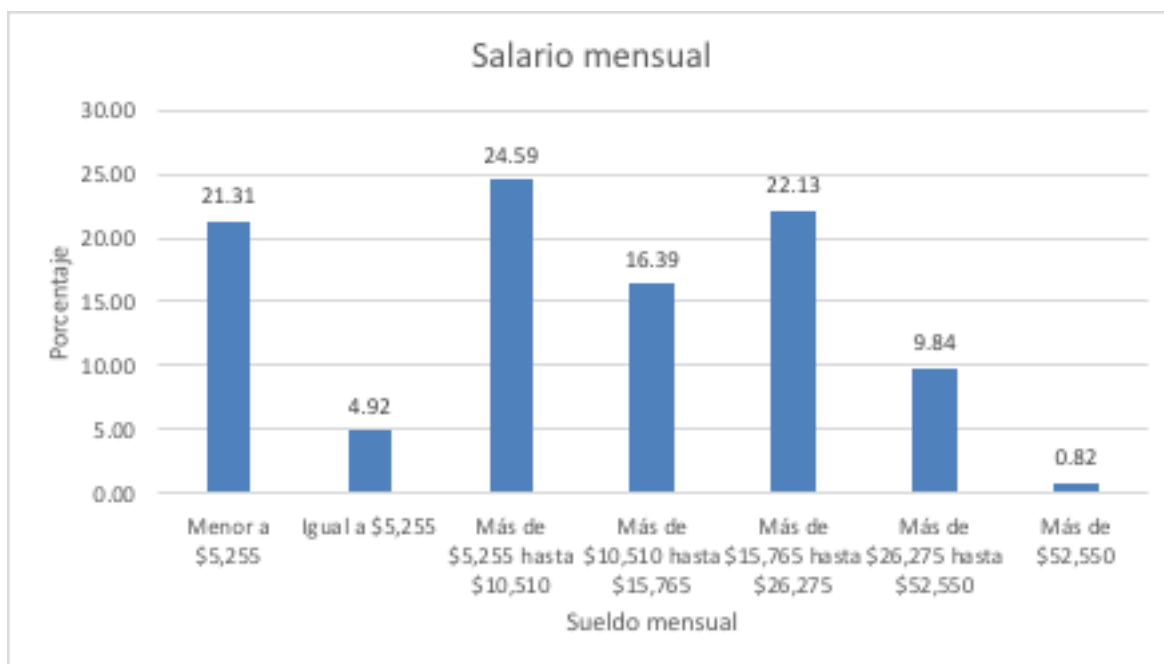
Gráfico 3. Salario mensual.

Finalmente, se presenta la información obtenida sobre el salario recibido mensualmente, el cual se expresa en rangos del salario mínimo mexicano. El 24.59% alcanza un salario de más de $5,255 hasta $10,510 mensuales, es decir, entre uno y dos salarios mínimos y menos del 1% percibe una cantidad mayor a los $52,550.