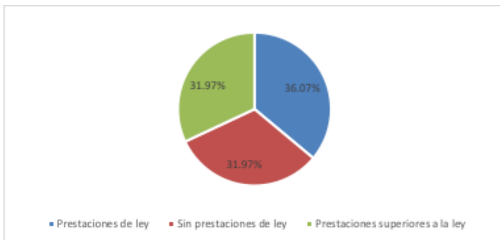
Gráfico 2. Condiciones laborales.