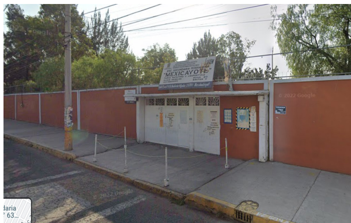
Figura 4. Fachada Principal

La institución ofrece servicios educativos en turno mixto de 7:00 am a 13:00 pm en el turno matutino y de 10:40 am a 16:50 pm. en turno vespertino. Los alumnos se encuentran divididos en 6 grupos por grado en el turno matutino y 3 por grado en el vespertino, la distribución de la matrícula se muestra en la figura 5.