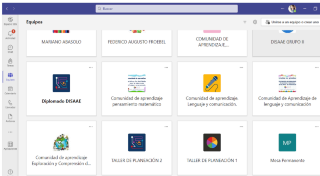
Figura 3. Herramienta de Office 365. TEAMS (Paquetería de Office 365, 2023)

En las comunidades de aprendizaje de reflexión de la práctica se sistematiza el acompañamiento realizado por el directivo después de realizar una visita de acompañamiento a continuación se observa un fragmento de la reflexión de una de las docentes.