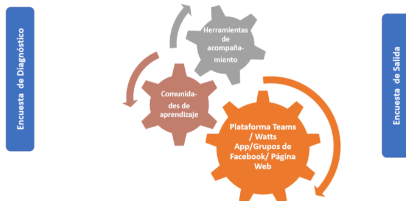
Figura 2. Ruta crítica de acompañamiento al docente