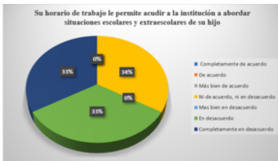
Gráfica 1. Porcentajes obtenidos al ítem: Su horario de trabajo le permite acudir a la institución a abordar situaciones escolares y extraescolares de su hijo

Los ítems que conforman al instrumento aplicado están relacionados con los rasgos que presentan los padres de familia y docentes en el involucramiento y comunicación para la participación asertiva dentro de la institución escolar. La muestra se aplicó en modalidad digital mediante un formulario de Google, con una escala tipo Likert con siete opciones de respuesta siendo los rangos de uno a siete con los siguientes valores: 1 Completamente de acuerdo, 2 De acuerdo, 3 Más bien de acuerdo, 4 Ni de acuerdo, ni en desacuerdo, 5 Mas bien en desacuerdo, 6 En desacuerdo y 7 Completamente en desacuerdo.