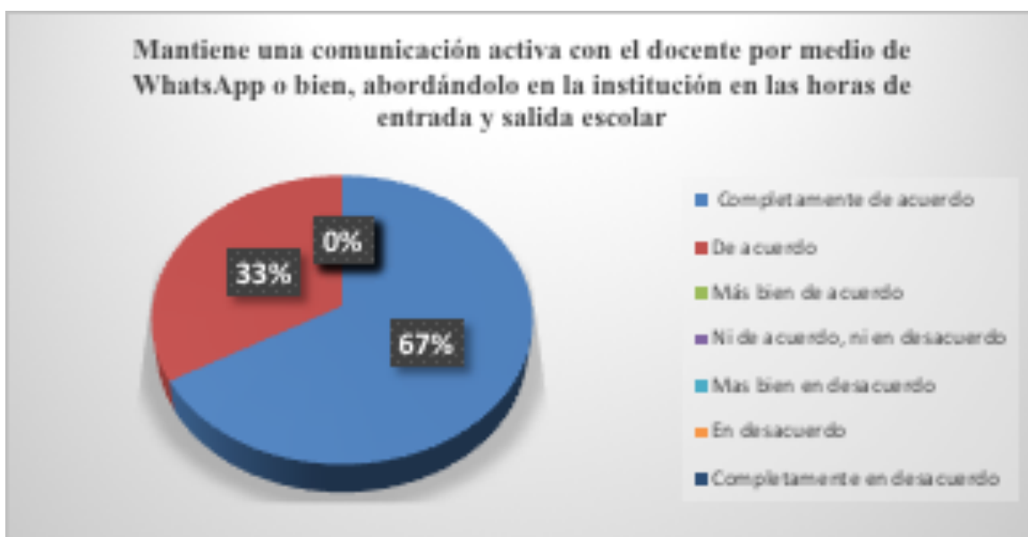
Gráfica 3. Porcentajes obtenidos al ítem: Mantiene una comunicación activa con el docente por medio de WhatsApp o bien, abordándolo en la institución en las horas de entrada y salida escolar

Por otra parte, el gráfico que se muestra indica que el ítem cuestiona a los participantes si se integran a las actividades en casa con su hijo relacionadas al ámbito escolar (tareas, trabajos manuales, revisión de libretas); un 34% se encuentra completamente de acuerdo y un 33% respondió que está de acuerdo respecto a que si se involucran en las actividades escolares de los educandos. Sin embargo, otro 33% menciona que ni de acuerdo, ni en desacuerdo respecto a al involucramiento por parte de los padres dentro de las tareas escolares y en esto puede influir diversos factores como la falta de tiempo por los horarios laborales de los padres o la falta de compromiso e interés por motivos personales (ver Gráfica 2).