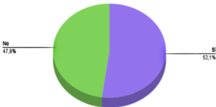
Percepción del estudiantado de la categoría "Género"